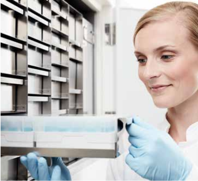
Edelstahlgestelle von Eppendorf: für optimale Raumnutzung und einfaches Wiederauffinden Ihrer Proben